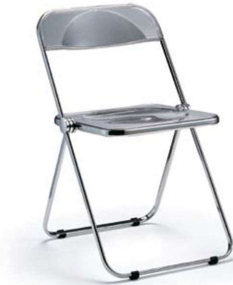
Design: Giancarlo Piretti