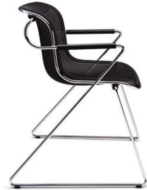
Design: Charles Pollock